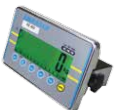
AE 402 Anzeigegeräte